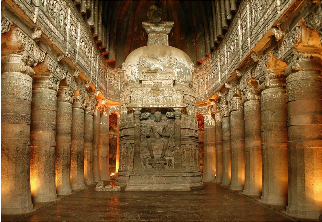
CHAITYA CON ESTUPA EN AJANTA AURANGABAD, MAHARASHTRA.