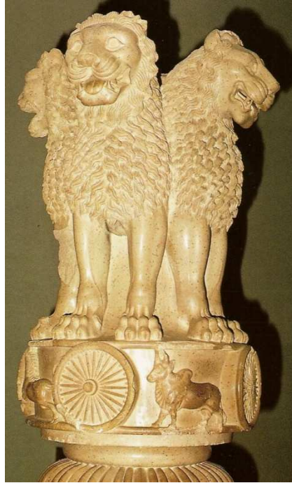
CAPITEL DE SARNATH, ÉPOCA MAURYA. SIGLO III A.N.E.