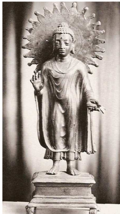
MAURYA-GUPTA. BUDA EN BRONCE DE PIE, ÉPOCA GUPTA, HACIA 400