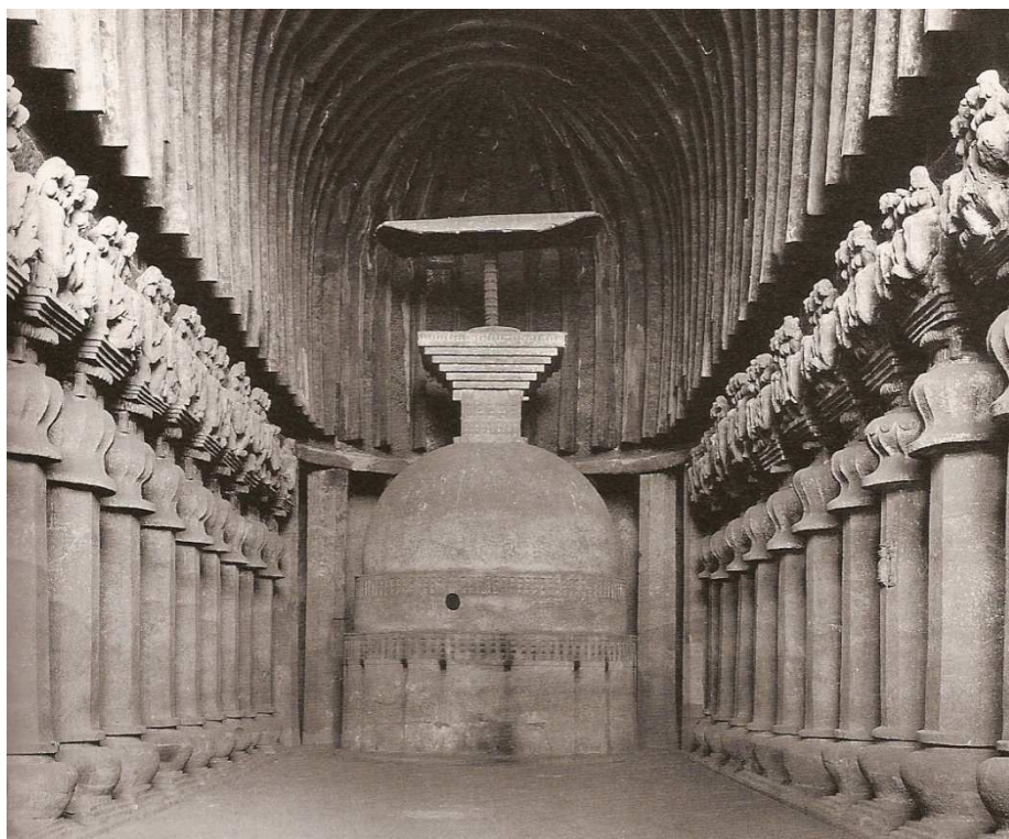
SALA DE LA CHAITYA DE KARLI. SIGLO II.