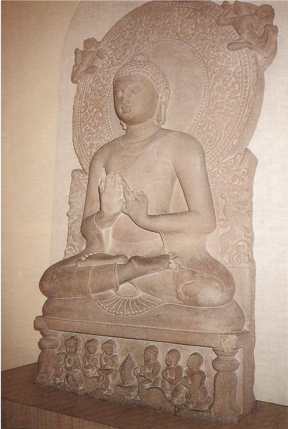
BUDA DE SARNATH. ÉPOCA GUPTA, ENTRE 400-450.