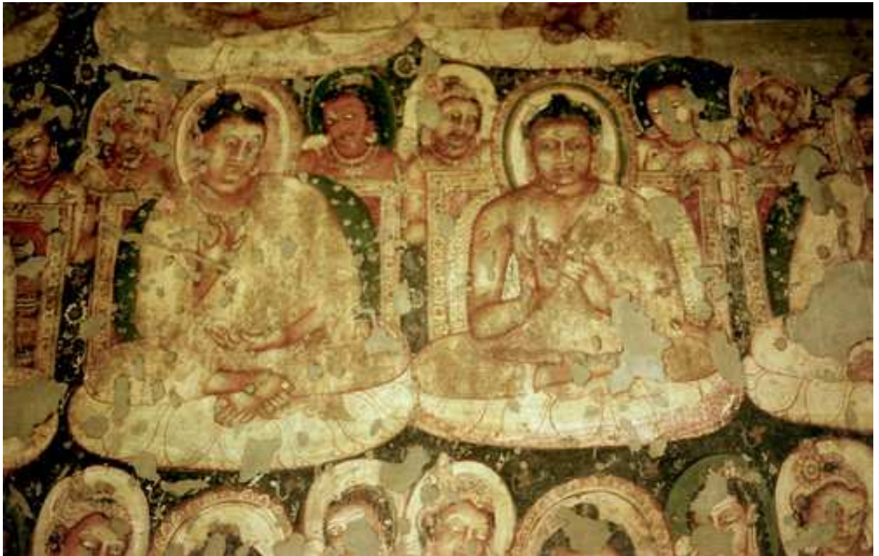
BUDAS EN AJANTA. MAURYA-GUPTA.