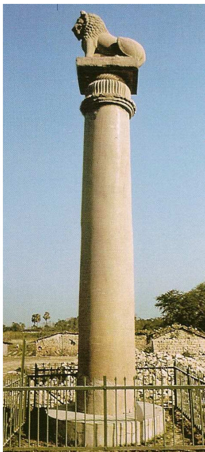
COLUMNA DE ASOKA EN VAISALI, BIHAR, SIGLO III A.N.E.