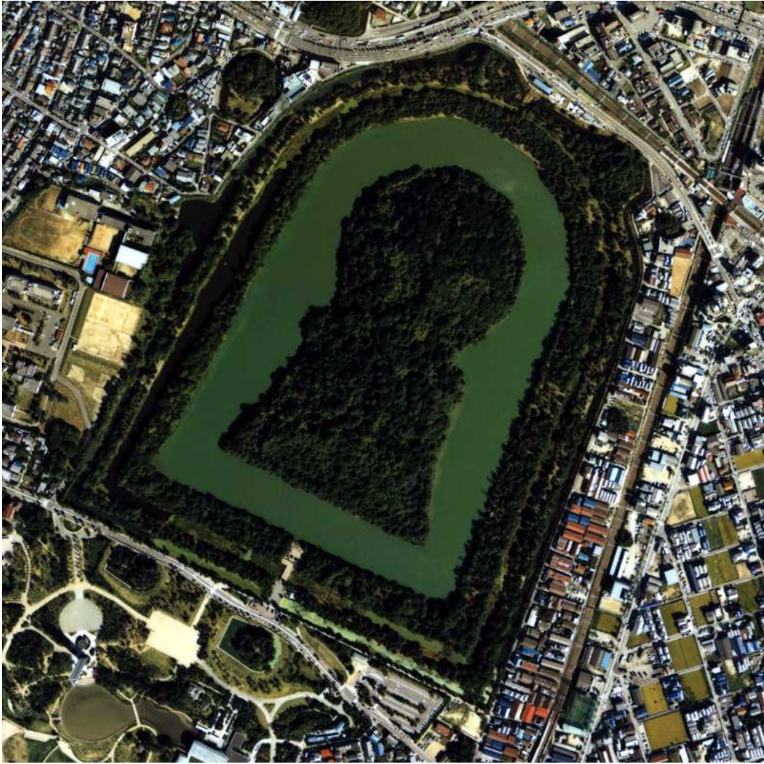
TUMBA KOFUN EN FORMA DE CERRADURA DEL EMPERADOR NINOTOKU, LLANURA DE OSAKA. SIGLO V.