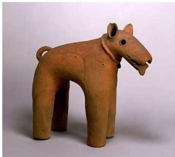
HANIWA CON FORMA DE CABALLO