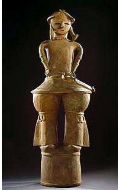
FIGURA FUNERARIA HANIWA