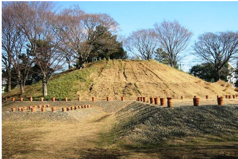
TÚMULO KOFUN NOGE-ÖTSUKA, SIGLO V.