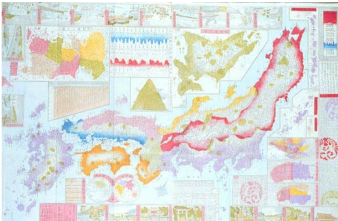
Japón. 1876, Maeda. Meiji Kaisei Dai Nippon Meisai Zenzu. Editado por Tatsunosuke Kabai. Publicado por Maeda en 1876.