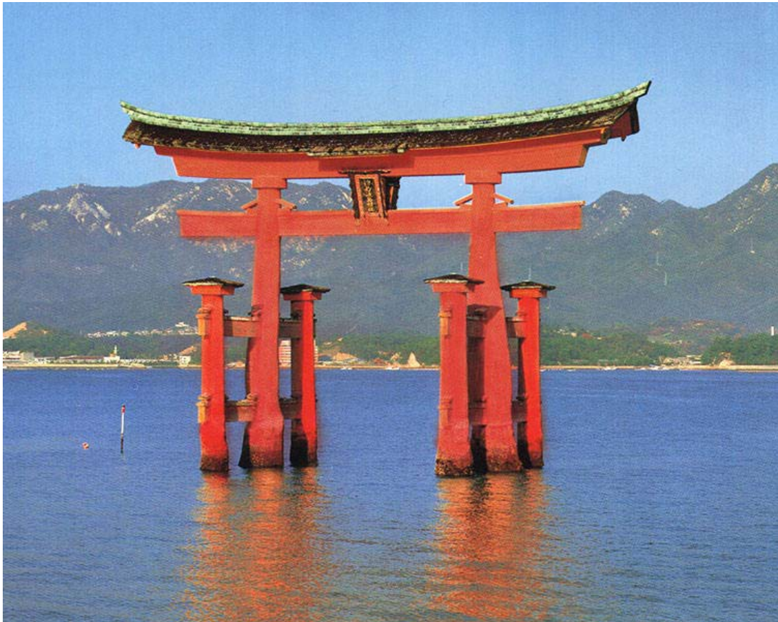
Puerta torii de tradición shinto. Miyahima.