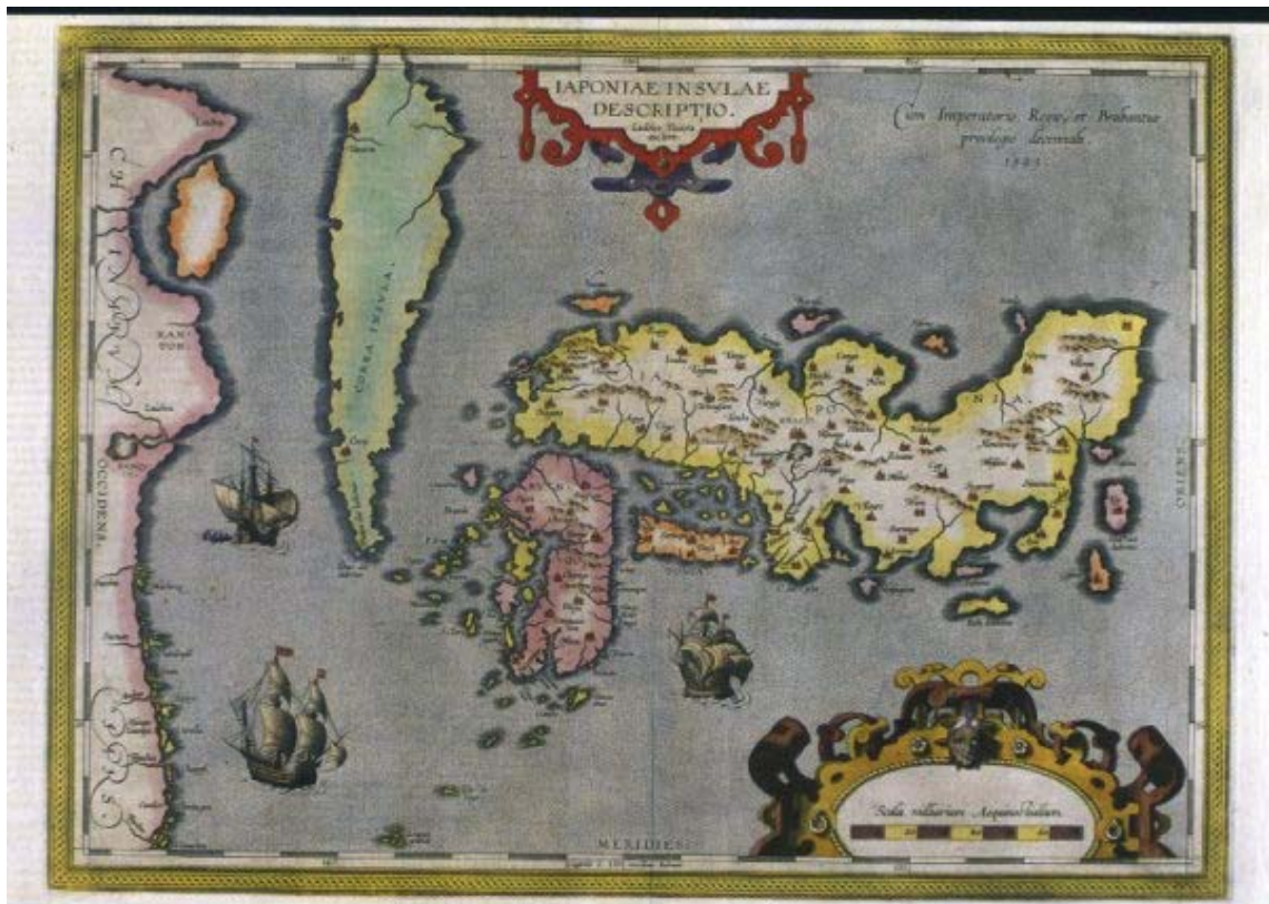
Mapa Iaponiae Insulae Descriptio, 1595, Abraham Ortelius.