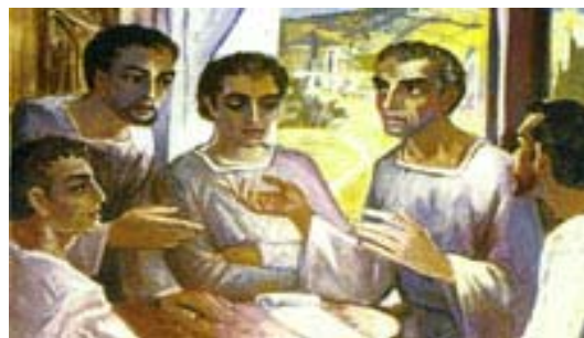
San Agustín con sus compañeros en Tagaste. Lukas Gastl (1981), Convento de los Agustinos de Würzburg (Alemania)