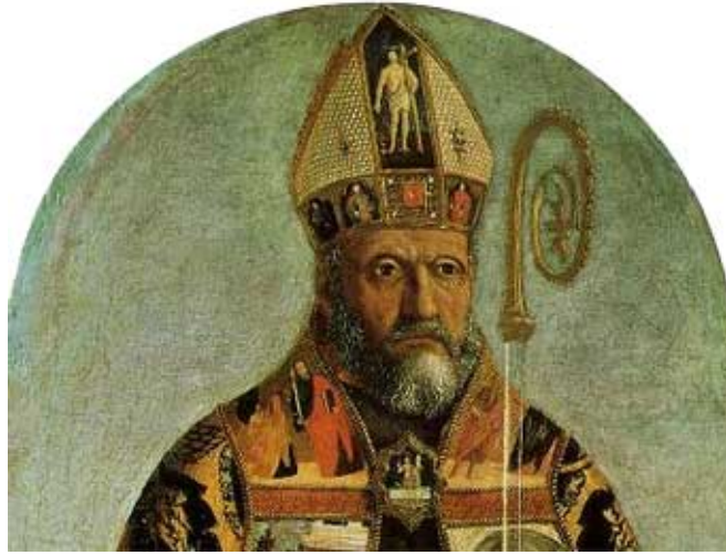
Obispo de Hipona.