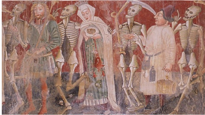
La Danza macabra - Beram (Pazin)