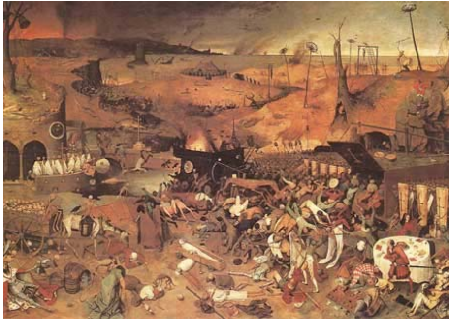
Pieter Bruegel: El triunfo de la muerte (1560 circa), Museo del Prado, Madrid.