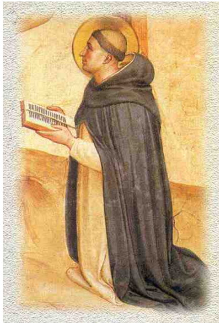
Iconografía de Santo Tomás de Aquino.