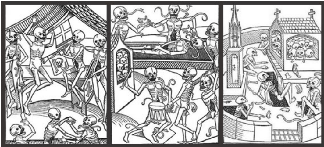
Fragmentos de la Danza de la muerte con personajes (Alemania, ca. 1486)